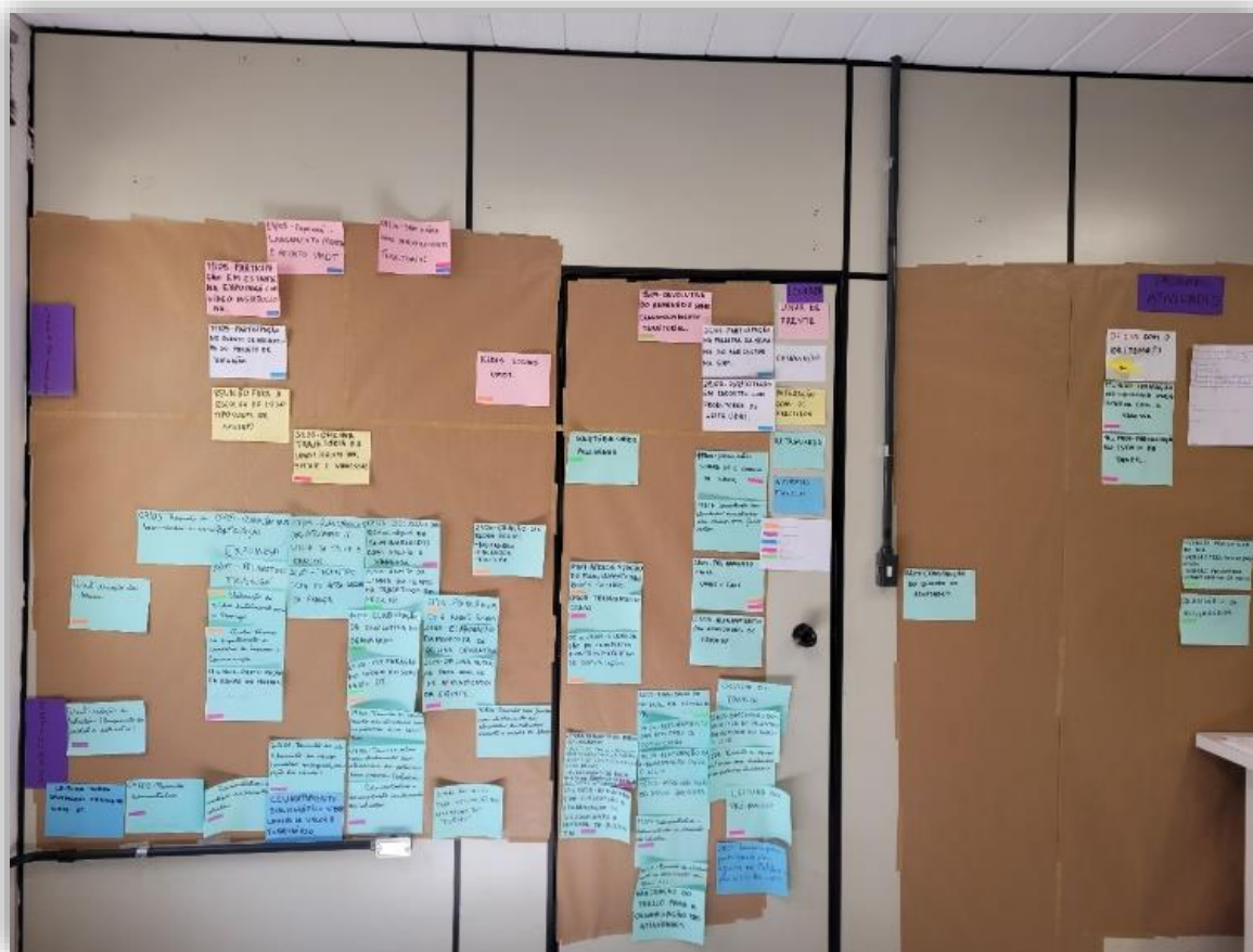
Figura 2: Mapa de atividades 2022 - UMDT

Essa oficina interna foi realizada no mês de agosto de 2022 e consistiu em construir um mapa de atividades desenvolvidas durante os meses de maio, junho e julho no projeto UMDT. Para elaborar o mapa foi feito um painel e colocadas as atividades em ordem cronológica, montando assim uma linha do tempo com as atividades. Na parte superior do painel foram fixadas as atividades de linha de frente, as quais foram entendidas como atividades de interação com todos os parceiros e a sociedade. As atividades de retaguarda foram fixadas na parte inferior do painel, objetivando a visualização da grande quantidade de atividades de bastidores necessárias para que uma atividade de linha de frente da UMDT ocorra. As atividades ainda foram classificadas de acordo com seu objetivo, tais como: comunicação, formação, elaboração de produto/material/resultado, entre outras.