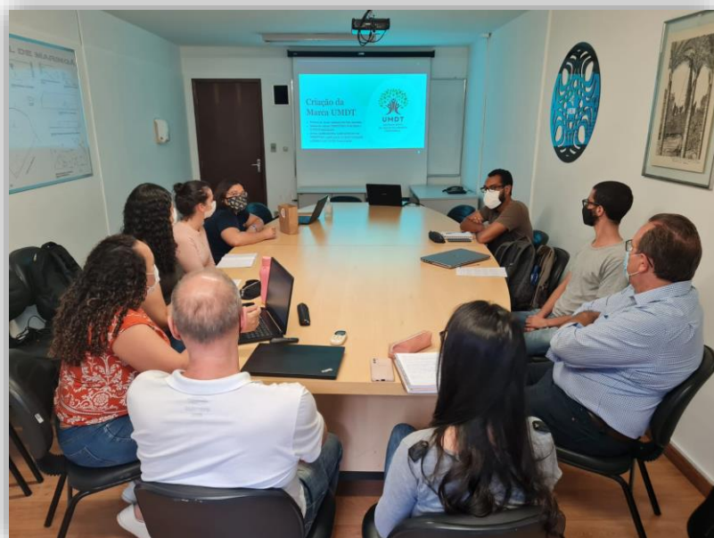
Figura 1: Equipe UMDT apresentando as atividades desenvolvidas nos meses de maio e junho de 2022.

Ao final desse documento encontra-se a apresentação realizada.