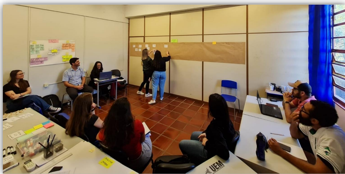
Figura 5: Equipe UMDT na construção do painel das atividades realizadas em 1 ano de projeto