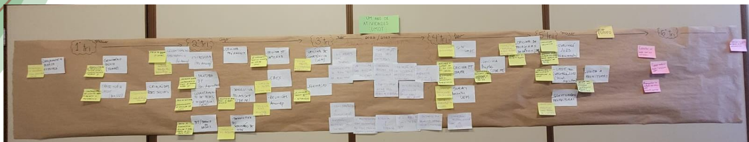
Figura 4: Painel das atividades realizadas em 1 ano de UMDT