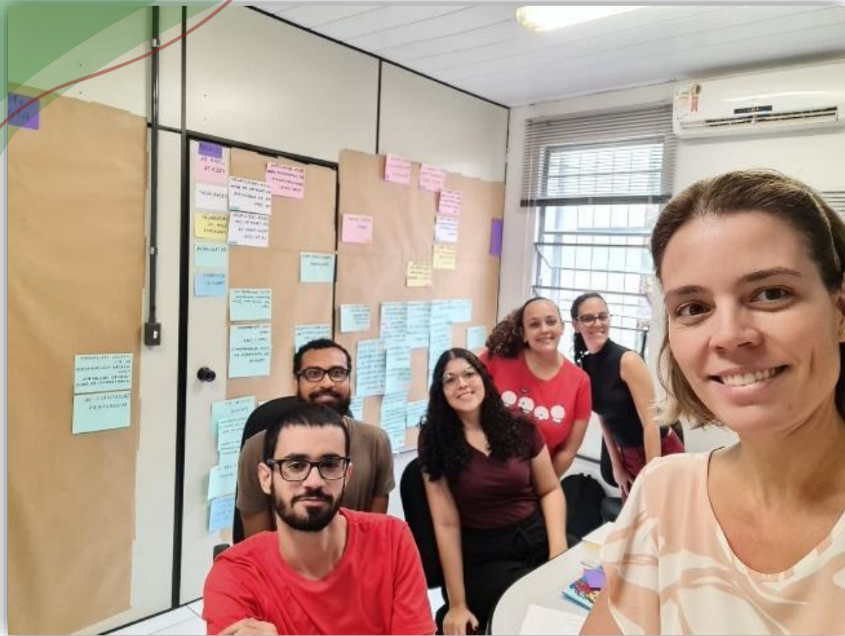
Figura 3: Equipe UMDT na construção do mapa de atividades 2022