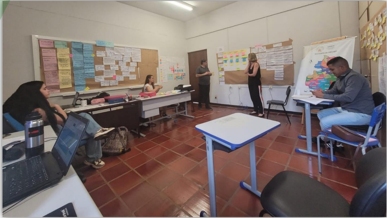
Figura 7: Equipe UMDT na Oficina “início do fim”